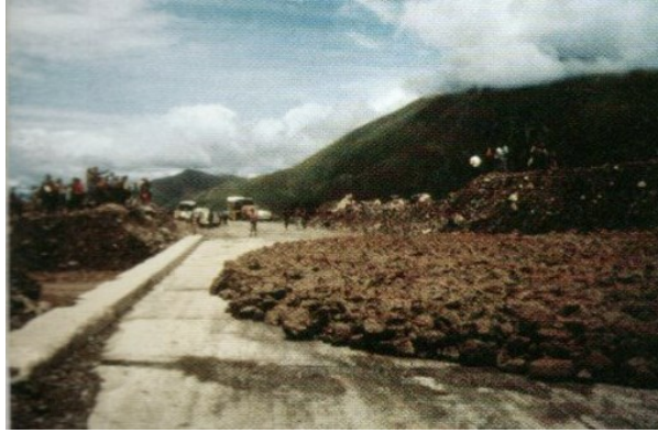
Figura N° 5: "Corte sobre Ruta Nacional N° 9 – Año 2005"