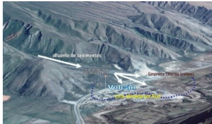
Figura N° 4: "Imagen satelital de la zona afectada por aludes y de la ubicación de la empresa Los Tilianes"