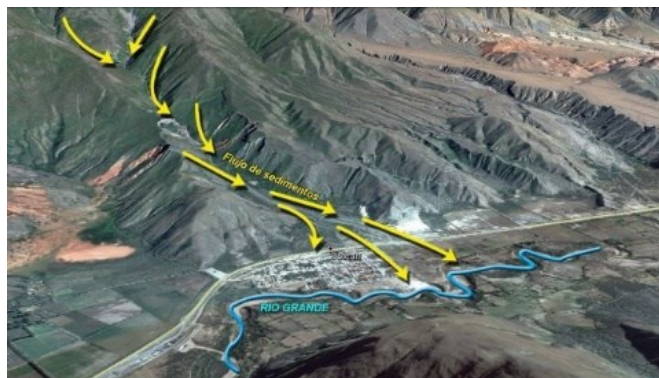
Figura N° 3: "El alud de Volcán"

los materiales sueltos se embeben y fluyen aguas abajo como un barro espeso, cargado de trozos rocosos de todo tamaño. Si a estas condiciones, le sumamos que el pueblo de Volcán se asienta en la base del cono de deyección donde se depositan las coladas de fango, estamos frente a una amenaza latente