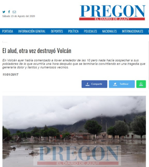
Figura N° 10: Comunicación del evento en medios de comunicación

De acuerdo con el momento del riesgo, es decir, el antes, durante y después, los canales de información pueden ser desde audiencias, reuniones, documentos, gacetillas y conferencias de prensa u otros. Respecto de la información sobre un desastre natural esta puede ser controlada por diversas fuentes tanto por observación directa y corroborada por otras observaciones directas