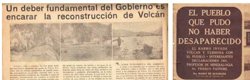
Figura N° 8: "Vulnerabilidad de Volcán"

Además, el gobierno local, provincial y nacional, tienen una deuda que se evidencia desde los grandes aluviones del siglo XX. Tal como se presenta en la publicación del diario El Día, del año 1945, se propone que el gobierno debe encarar la reconstrucción del pueblo de Volcán. Este pedido se volvió a escuchar en el año 2017, cuando los pobladores locales exigían al gobierno, la reconstrucción y soluciones definitivas ante la problemática de los aluviones de barro.