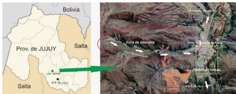
Figura N° 2: “La provincia de Jujuy y la amenaza de Volcán” – Fuente: Elaboración propia.

Como se mencionó anteriormente, la localidad de Volcán está ubicada en el departamento de Tumbaya y se localiza en el inicio de la Quebrada de Humahuaca, provincia de Jujuy. Alonso (2011) explica que “en el lugar, es posible observar un amplio abanico formado por materiales aluvionales que han descendido por una quebrada que drena hacia el Rio Grande desde las escarpadas laderas occidentales, a más de 4.000 msnm” (p. 167).