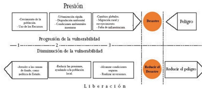
Figura N° 9: Modelo PAR - Fuente: Elaboración propia en base al Modelo de Blaikie (1996)

El gráfico anterior puede explicarse entendiendo las: