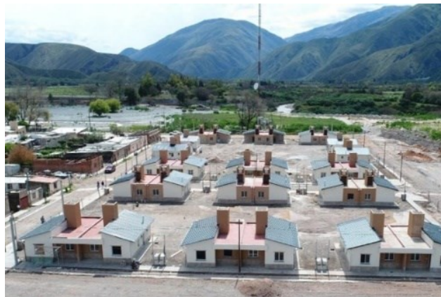
Figura N° 7: "Nuevas viviendas en Volcán"

Consecuentemente, se evidencian algunos avances para poder atender a estas cuestiones físicas y naturales, y están orientadas al desarrollo de infraestructuras de viviendas en zonas más alejadas al cono de deyección, y con materiales más resistentes.